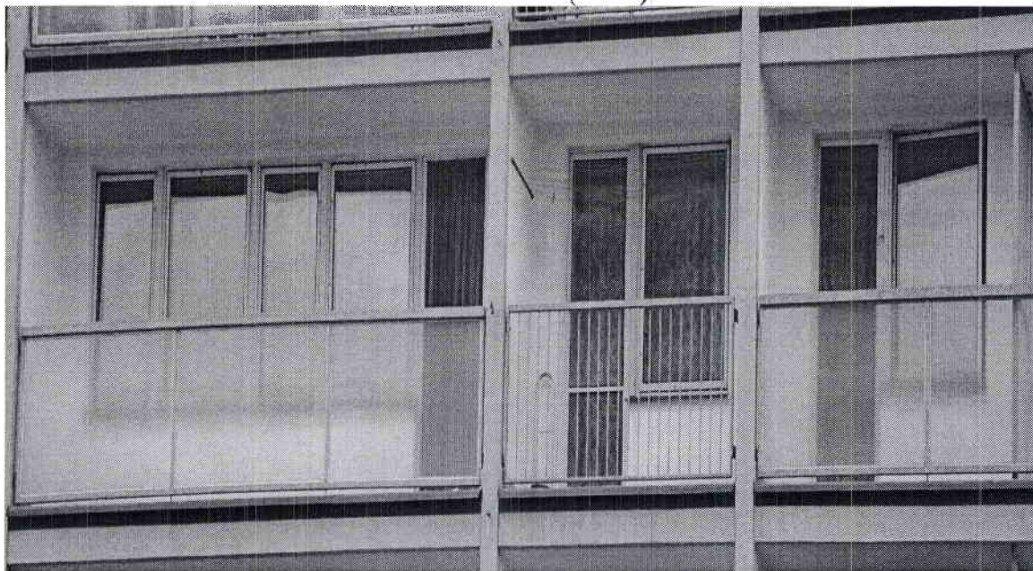
Vršovická severní strana