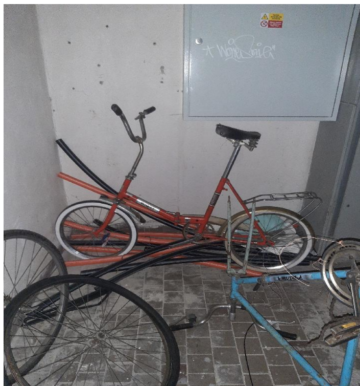
Příloha 3. Kradená kola, tentokrát již jako torza v přízemí čp.1464